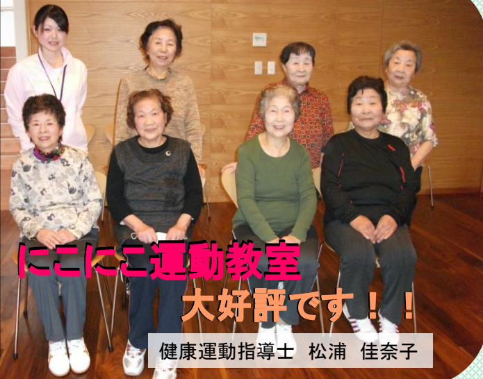
にこにこ運動教室 大好評です!!