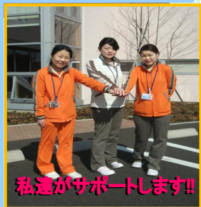
私達がサポートします!!