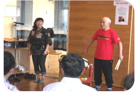
8月27日：ちょんまげーザコンサート