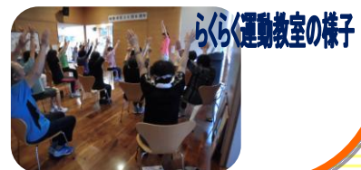
らくらく運動教室の様子

メディカルフィットネスみらいは 安心して健康維持・向上できるための運動施設です!!